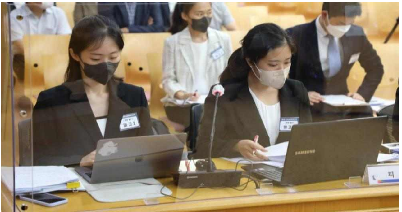
▲ 본·결선 현장 사진