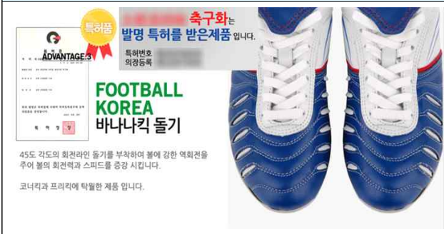
△ 소멸된 권리를 유효한 권리로 표시