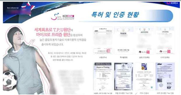
△ 등록 거절된 출원번호 표시