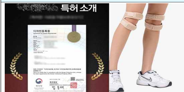
△ 해당 제품과 무관한 권리 표시