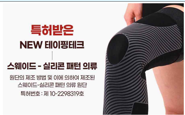
△ 지재권의 종류(특허), 명칭 및 등록번호 표시