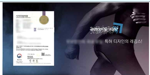
△ 지재권 명칭 오기 (디자인→특허)