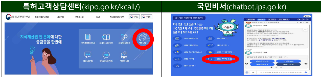
(기존 2개 접속경로)