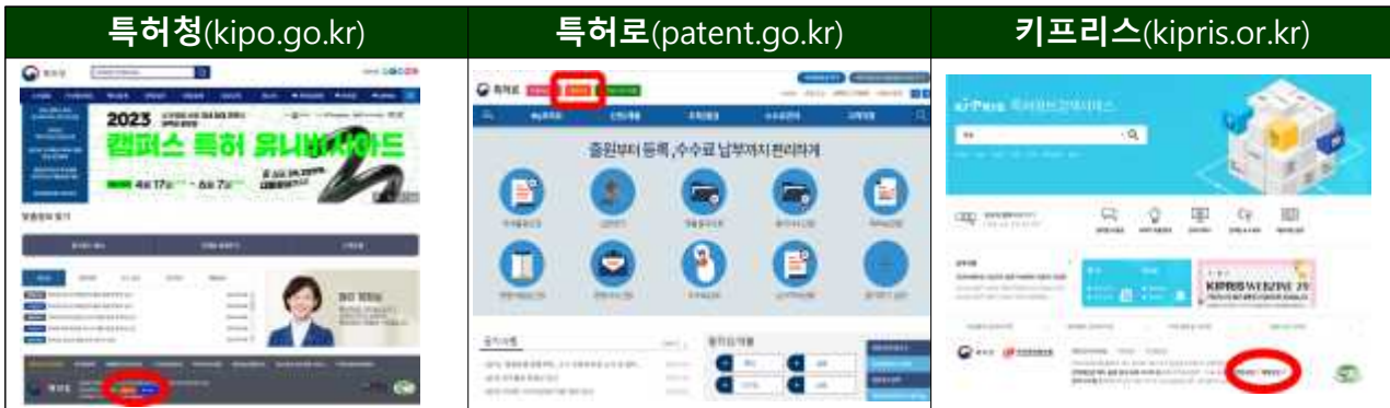
(추가 3개 접속경로)