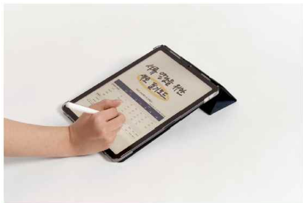
<세로 필기 보조각> 약 12.5도