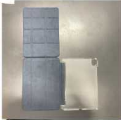
<전개도> 플립 형태로 구성