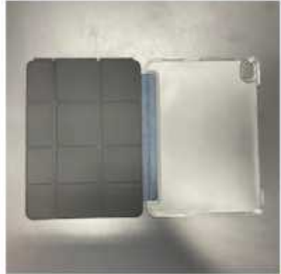
<기본 오픈> 가로 2선 + 세로 3선 교차