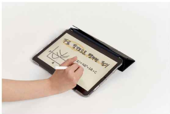
<가로 필기 보조각> 약 12.5도