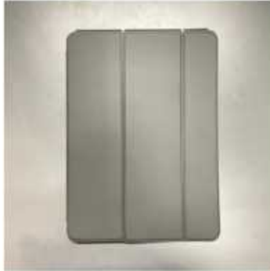
<기본 전면> 가로 2선 노출