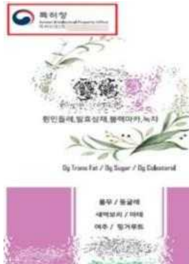
등록 거절된 권리를 표시