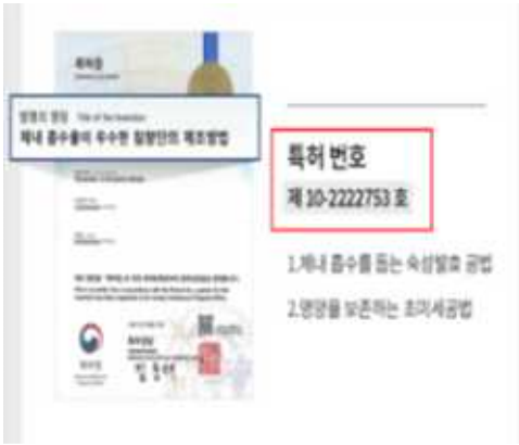
지식재산권 명칭, 번호가 잘 보이도록 표시