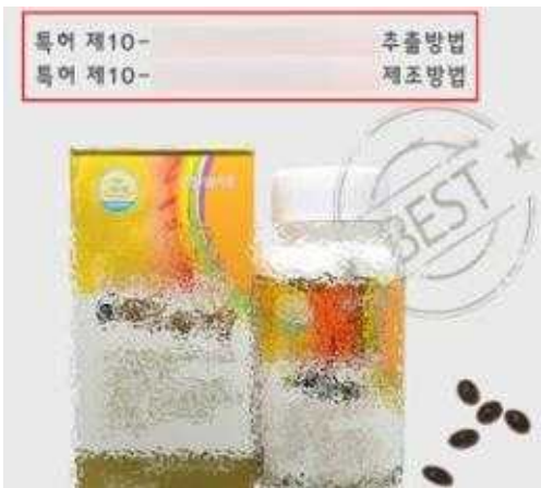
이미 소멸된 특허번호 표시