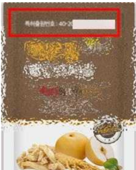
상표를 특허로 표시