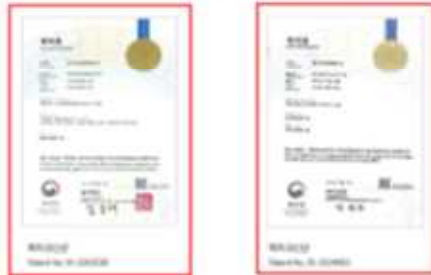
특허증과 함께 표시

락토바실러스 플란타룸 L.plantarum KBL 396 락토바실러스 퍼멘텀 L.fermentum KBL 375