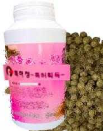
특허출원을 특허등록(획득)으로 표시