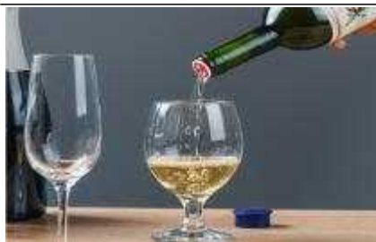
와인 산패 방지 마개 티키퍼 (’22년 지원) 판매 : 네이버스마트스토어_티키퍼

생활발명코리아를 통해 지난 10년간 접수된 아이디어는 17,568건으로, 이 중 384건에 대해 지원프로그램을 제공해 149건이 창업 및 제품출시에 성공했다.