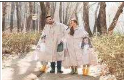
아이와 함께 입는 우비 캥거우비 (’21년 지원) 판매 : 네이버스마트스토어_솔레마망