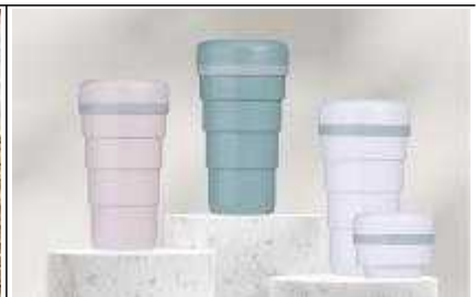
접히는 텀블러 포켓텀블러 (’20년 지원) 판매 : 공식사이트_텀블러스토리