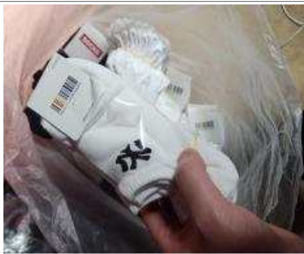
창고(다락방)에 보관된 위조상품들