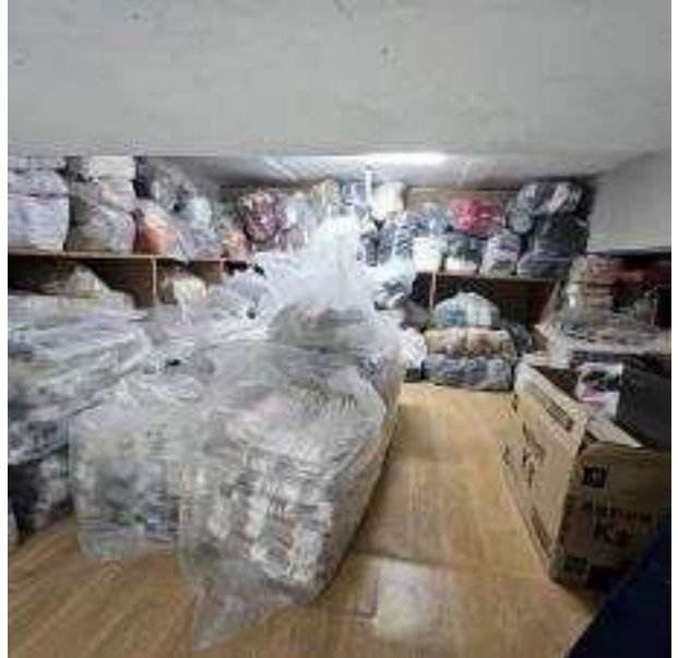
창고(다락방)에 보관된 위조상품들