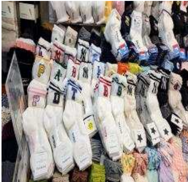
전시되어 있는 상표 침해 제품