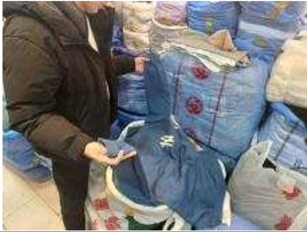
유통 현장 단속 사진