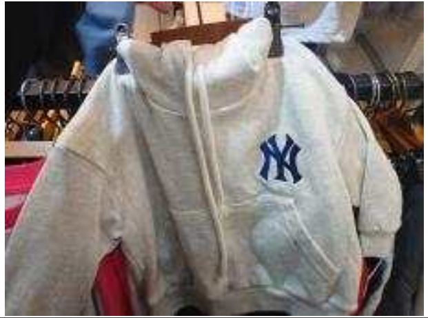
전시되어 있는 상표 침해 제품