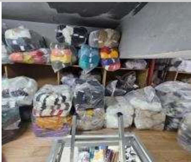
창고(다락방)에 보관된 위조상품들