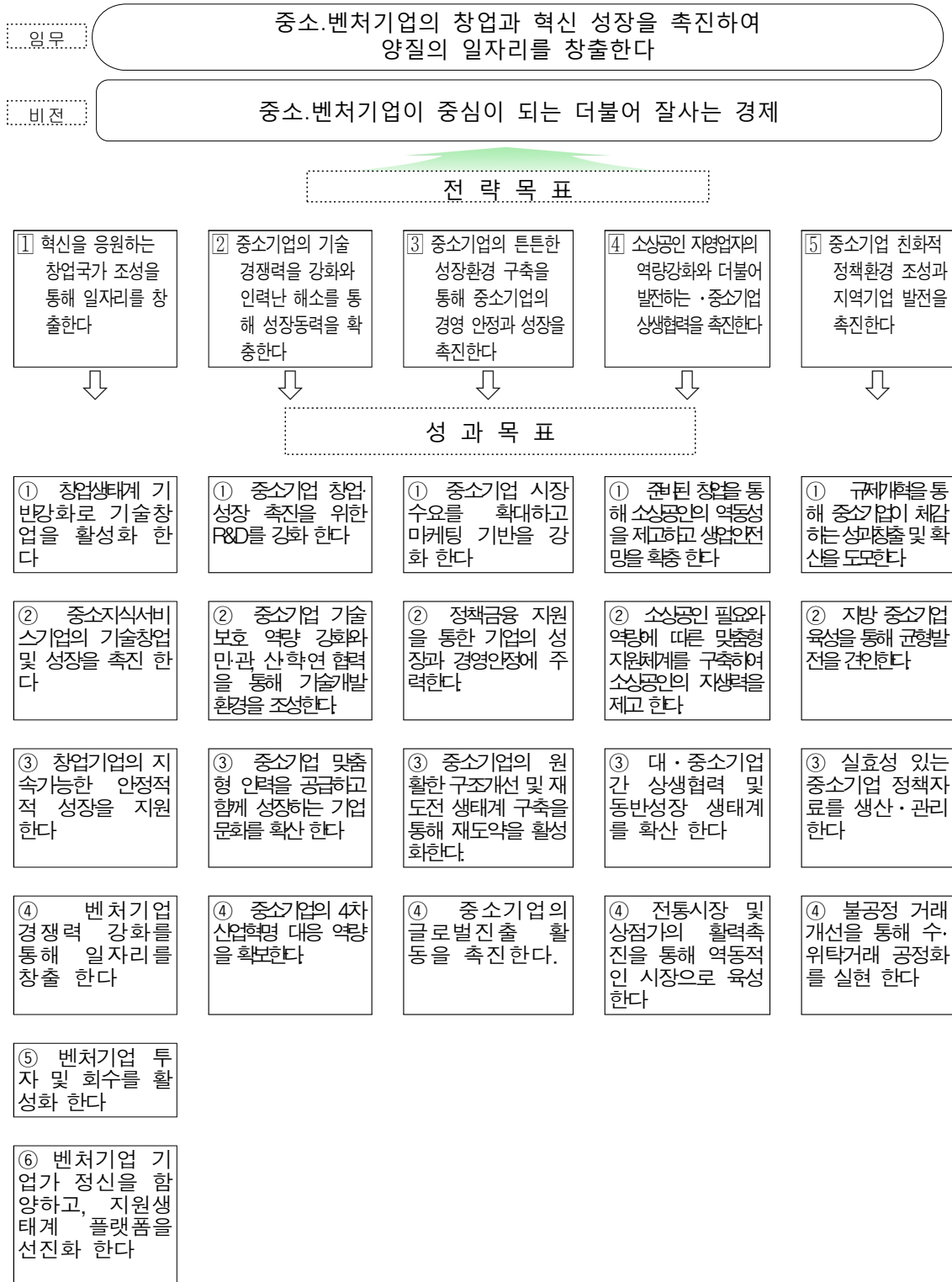
<그림 2-1> 중소벤처기업부 2018년도 성과관리 시행계획의 목표 체계