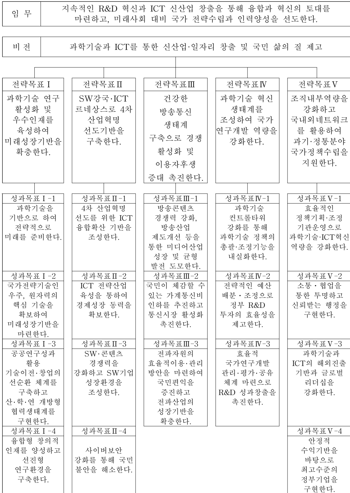
<그림 2-2> 과기정통부 2018년도 성과관리 시행계획의 목표 체계