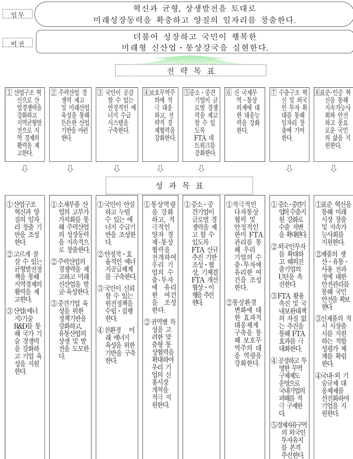
<그림 2-3> 산업통상자원부 2018년도 성과관리 시행계획의 목표 체계

자료: 산업통상자원부 (2018). “2018년도 성과관리 시행계획”. p.42.